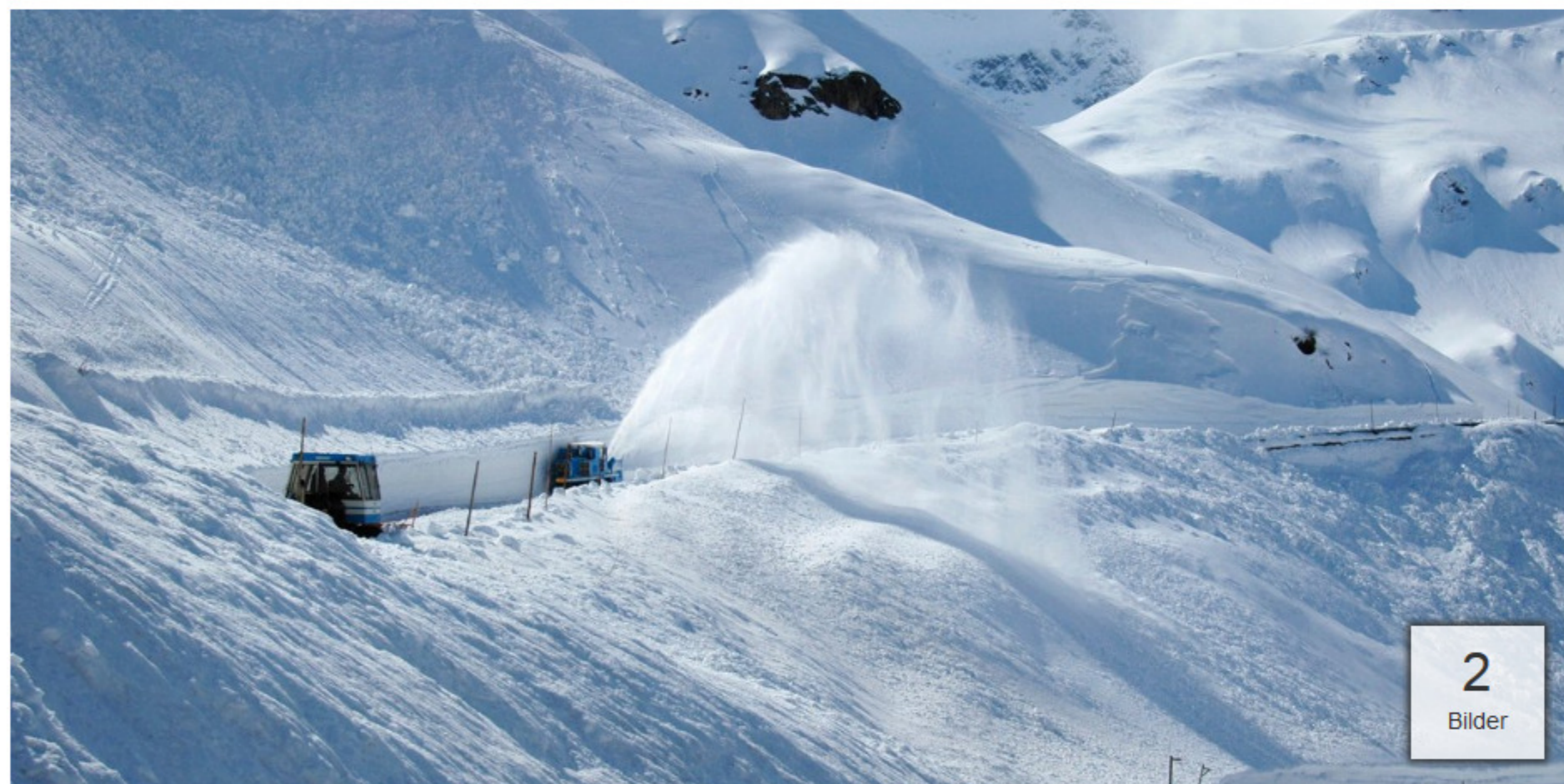
Die Großglockner-Hochalpenstraße ist als Unesco-Welterbe nominiert. Das stößt nicht überall auf Gegenliebe. Naturschützer sehen im Tourismus eine Gefahr für die Landschaft • Foto: grossglockner.at • hochgeladen von Verena Niedermüller

29. Januar 2019, 17:00 Uhr • 60x gelesen • 0 • 0